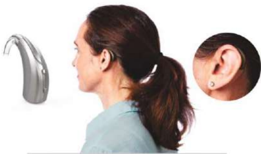
BTE 13 aizauss risinājumi