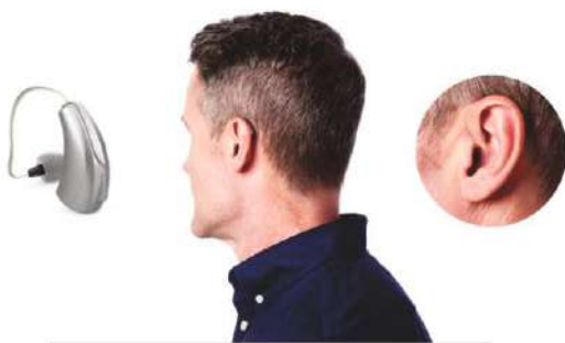
micro RIC mazu izmēru ierīces ar resīveriem