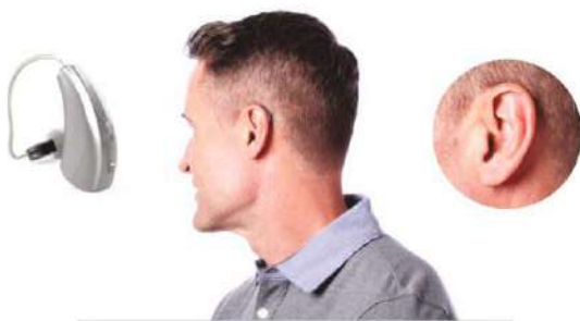
RIC 312 aparāti ar resīveriem