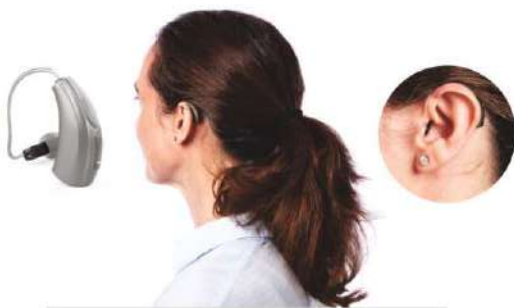
RIC R lādējami aparāti ar resīveriem